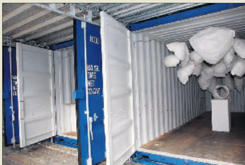
Chaque container ouvre sa porte à un monde artistique différent.