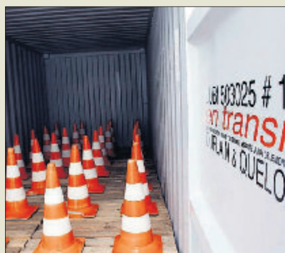
Le container a ici été utilisé d'abord comme moyen de transport, puis comme lieu d'exposition de «Lubi», de Duplain et Queloz.