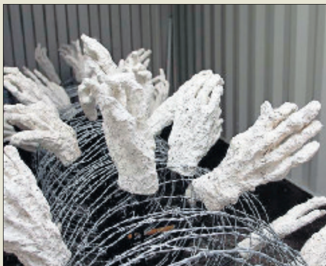
«Gaïa gaga», l'installation de Christiane Dubois.