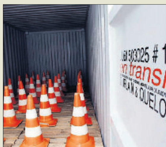
Le container a ici été utilisé d'abord comme moyen de transport, puis comme lieu d'exposition de «Lubi», de Duplain et Queloz.